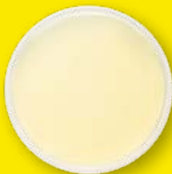
Bakteriální kultura z netkané tkaniny nového kabinového filtru