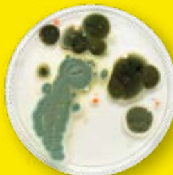
Bakteriální kultura z netkané tkaniny čištěného kabinového filtru